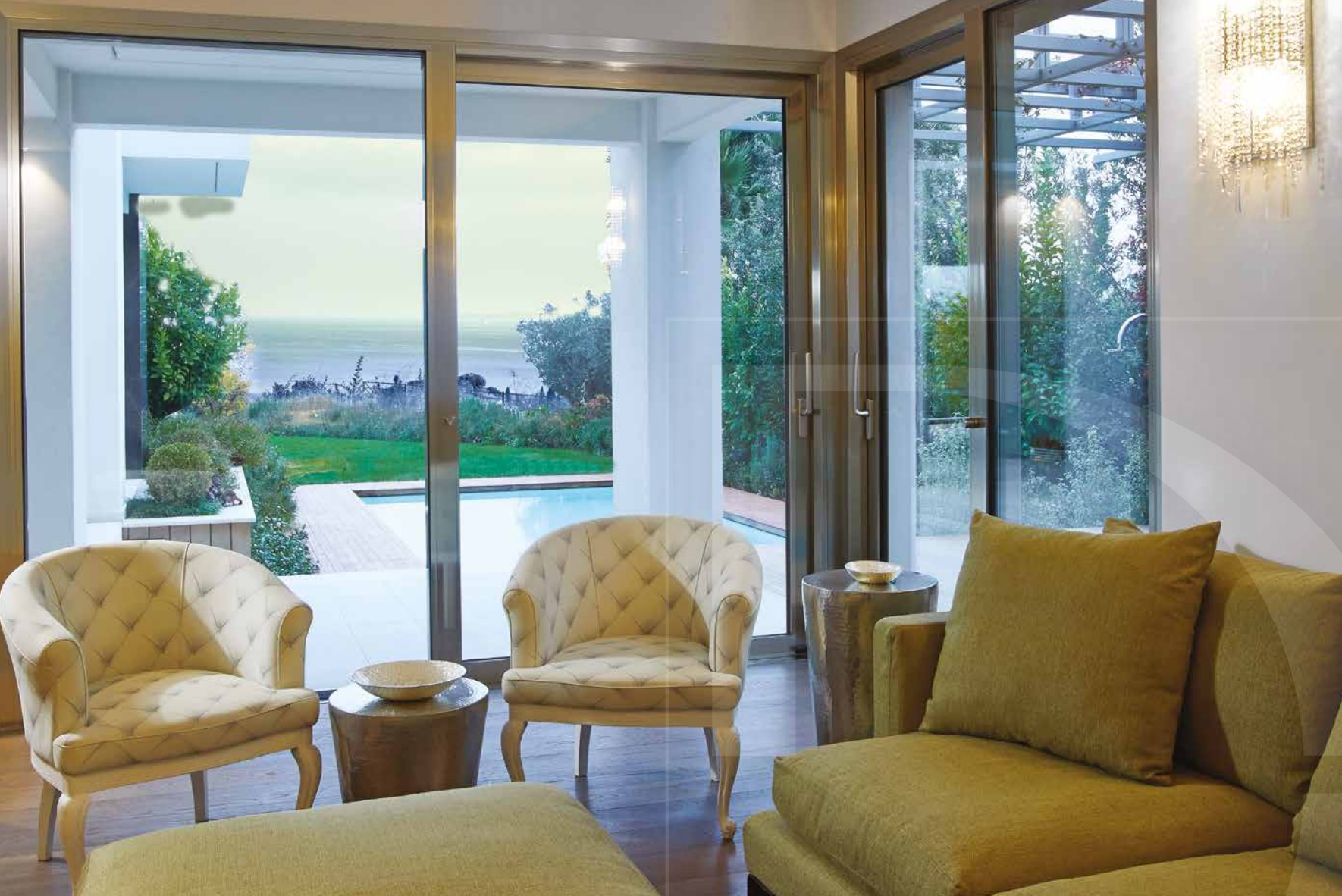
Sopra: l'angolo del living è aperto sulla piscina e sul parco privato grazie a serramenti di ampia dimensione che sposano i cromatismi della casa attraverso profili inusuali dalle sfumature cangianti nei toni del bronzo, dell'oro e dell'acciaio; i colori del parco sono richiamati all'interno dalla tonalità del tessuto del divano Long Island di Flexform, abbinato a poltrone e tavolini Baxter. A destra: un living spazioso nel quale la rigorosità delle geometrie è spezzata dalla credenza classica di Creazioni in foglia oro e dalla giocosità delle lampade a cascata sulle pareti (Abitare Design, Proposte per un mobile qualificato, il Laboratorio delle idee - Trento).