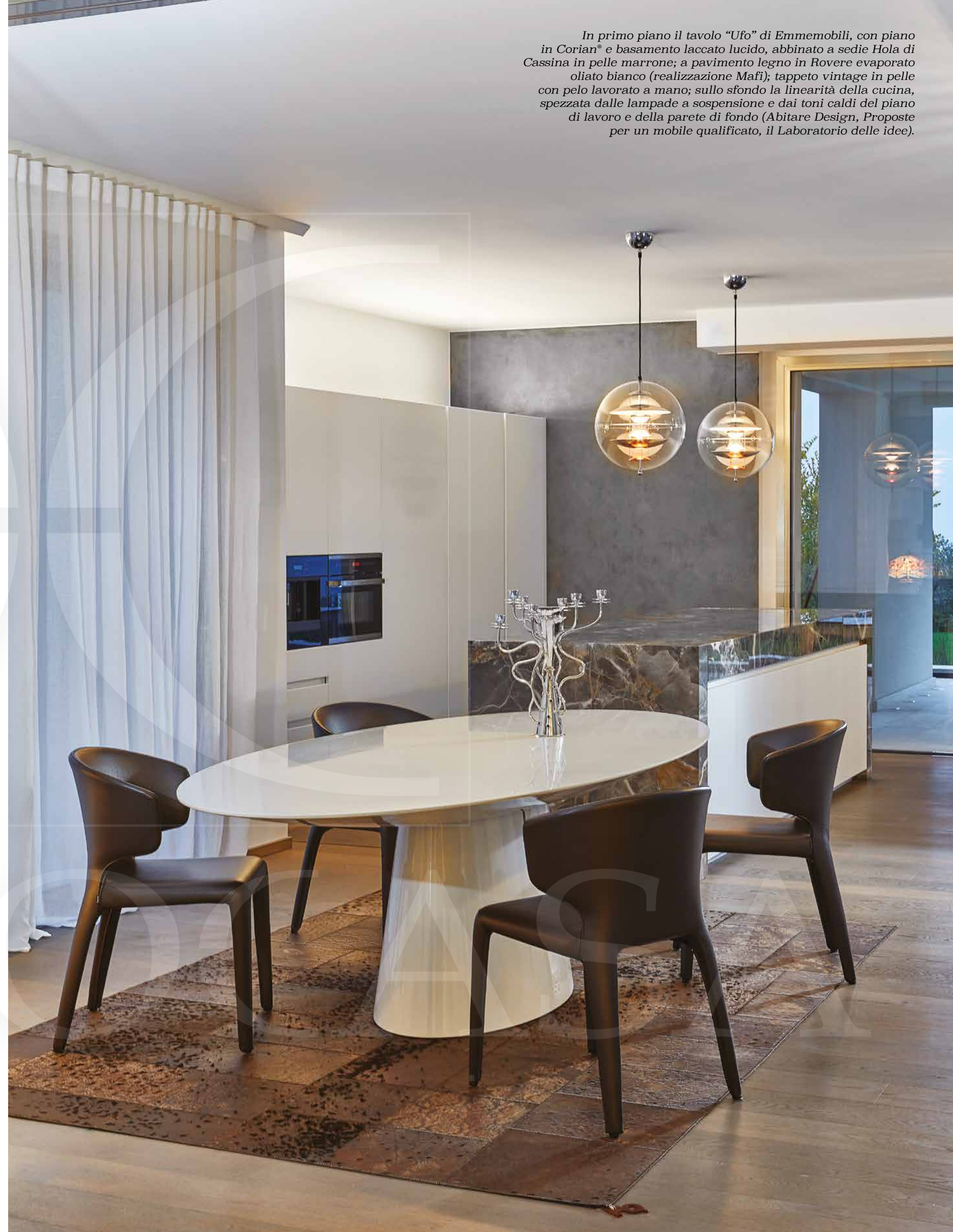
In primo piano il tavolo "Ufo" di Emmobili, con piano in Corian® e basamento laccato lucido, abbinato a sedie Hola di Cassina in pelle marrone; a pavimento legno in Rovere evaporato oliato bianco (realizzazione Mafi); tappeto vintage in pelle con pelo lavorato a mano; sullo sfondo la linearità della cucina, spezzata dalle lampade a sospensione e dai toni caldi del piano di lavoro e della parete di fondo (Abitare Design, Proposte per un mobile qualificato, il Laboratorio delle idee).