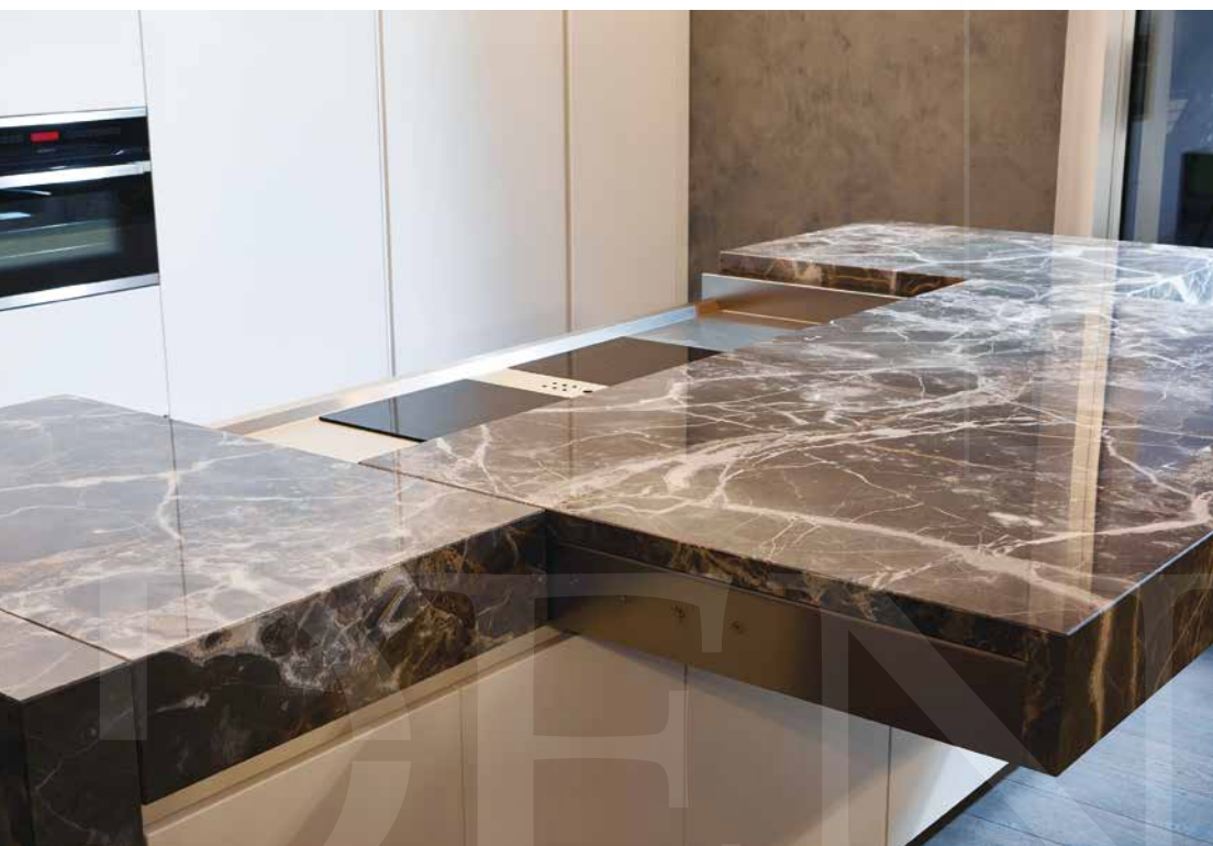
Cucina funzionale laccata bianca con contenitivi che nascondono il lavandino; a conferire un tono caldo, il marmo con venature oro del piano di lavoro dell'isola, amovibile, che nasconde il piano cottura; le suggestive sospensioni VP Globe di Verner Panton del 1969 sono integrate dalla retroilluminazione delle colonne contenitive; a parete sovrapposizione di colori dall'effetto materico con velatura nei toni grigi che richiamano il piano dell'isola (Abitare Design, Proposte per un mobile qualificato, il Laboratorio delle idee).