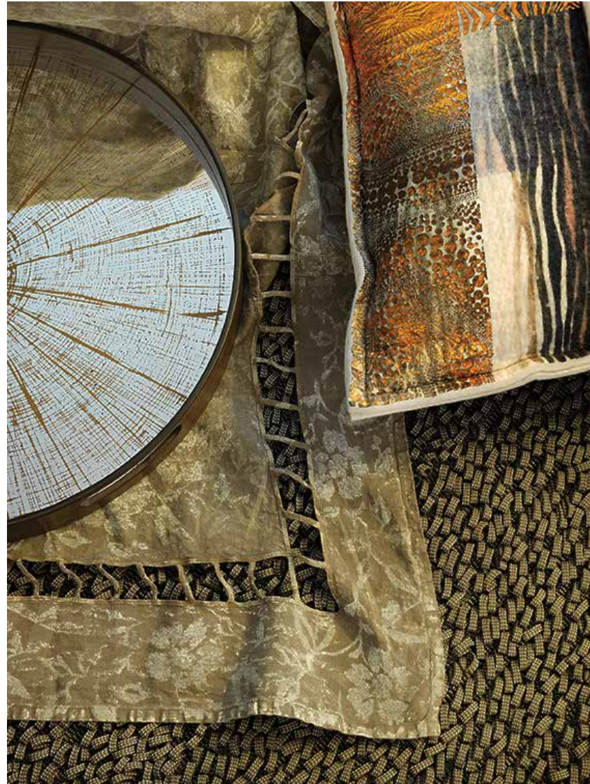
Sopra: un dettaglio del drappo di Society Limonta realizzato in lino con una particolare lavorazione di trama e fantasia dall'artista decoratore Mario Sturlese, unica ed inimitabile; vasoio anch'esso realizzato da Mario Sturlese che riprende i dettagli di un ceppo in legno. Nella pagina accanto: una grande luminosità naturale permea il living; maestoso il volume del divano Budapest di Paola Navone per Baxter, caratterizzato da una composizione a blocchi con cuscini e braccioli di grandi dimensioni e linee nette ed evidenti unite ad abbondanti imbottiture; tappeto Air di Paola Lenti con texture formata da punti bouclé eseguiti con una treccia piatta tinta unita in filato Rope; lampada Serena di Erasmo Figini per Riva 1920, dal particolare valore emotivo per i proprietari, così come lo stretto rapporto affettivo tra il designer e la città di Venezia da cui trae ispirazione, con il riuso ecologico delle Briccole di Rovere (Abitare Design, Proposte per un mobile qualificato, il Laboratorio delle Idee).