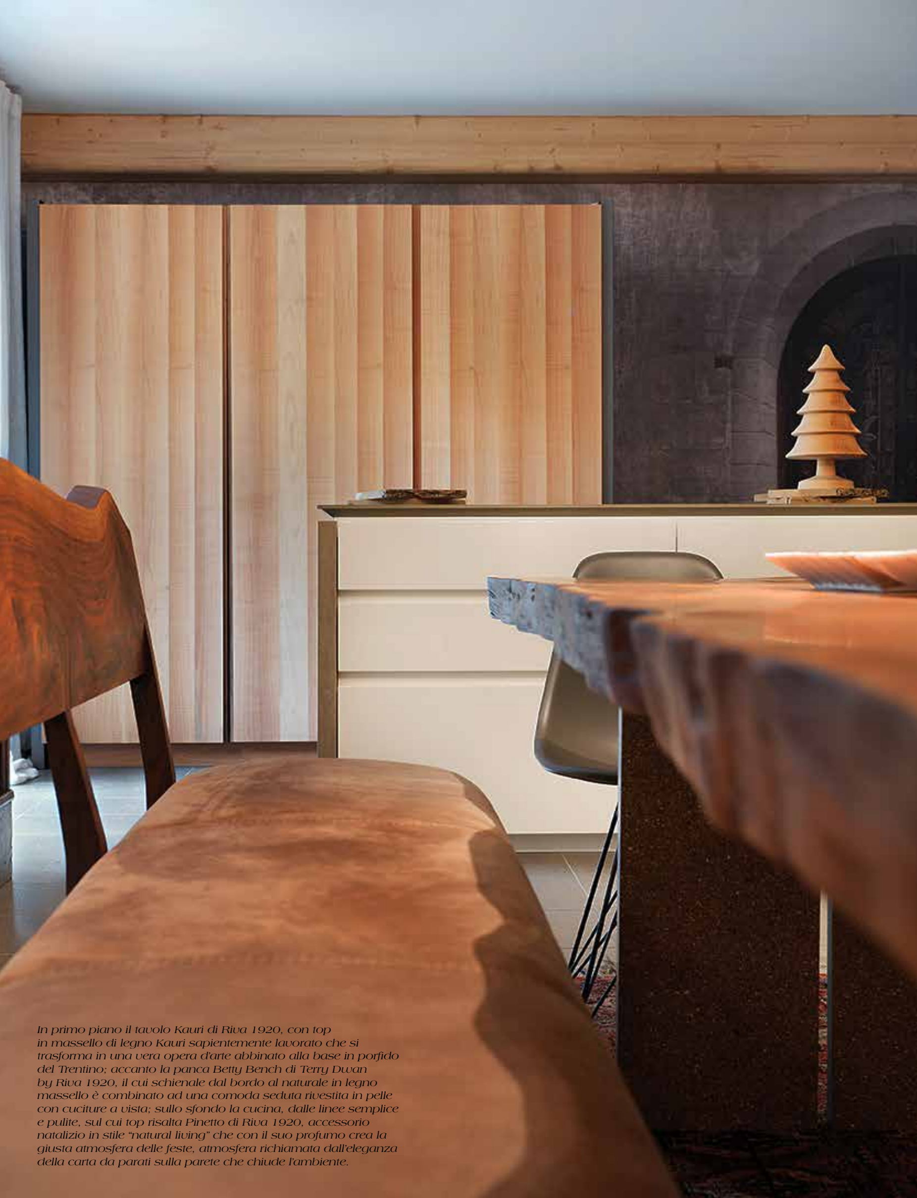
In primo piano il tavolo Kauri di Riva 1920, con top in massello di legno Kauri sapientemente lavorato che si trasforma in una vera opera d'arte abbinato alla base in porfido del Trentino; accanto la panca Betty Bench di Terry Dwan by Riva 1920, il cui schienale dal bordo al naturale in legno massello è combinato ad una comoda seduta rivestita in pelle con cuciture a vista; sullo sfondo la cucina, dalle linee semplici e pulite, sul cui top risalta Pinetto di Riva 1920, accessorio natalizio in stile "natural living" che con il suo profumo crea la giusta atmosfera delle feste, atmosfera richiamata dall'eleganza della carta da parati sulla parete che chiude l'ambiente.

Accanto: richiamo al passato il lavandino a parete, così come l'elegante affettatrice Berkel, sinonimo di una contemporaneità che ha alle spalle cento anni di storia professionale.