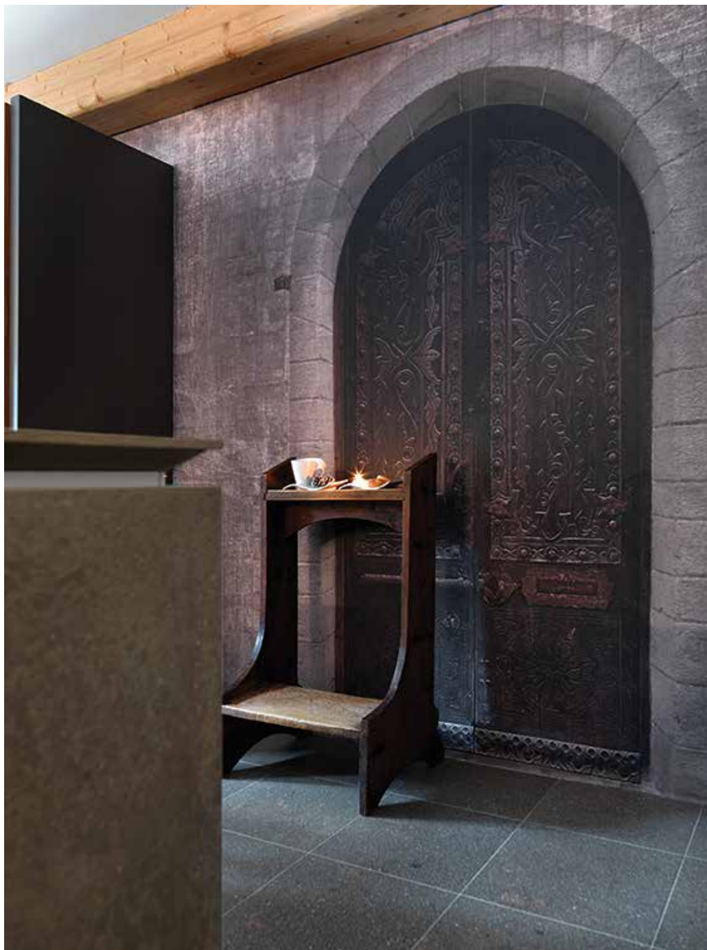
Un volume suggestivo caratterizzato dalla carta da parati che racchiude perfettamente l'atmosfera del periodo natalizio e dell'anima della casa stessa: elegante, sobria e intima.