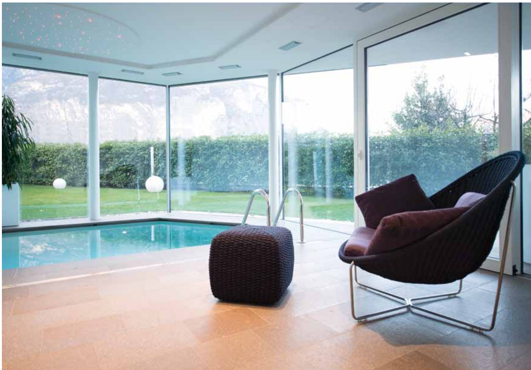
Zona relax. La piscina collegata al giardino è l'ideale per godersi il meritato riposo sulla poltrona in corda rope di Paola Lenti (Abitare Design, proposte per un mobile qualificato, il laboratorio delle idee - Trento).