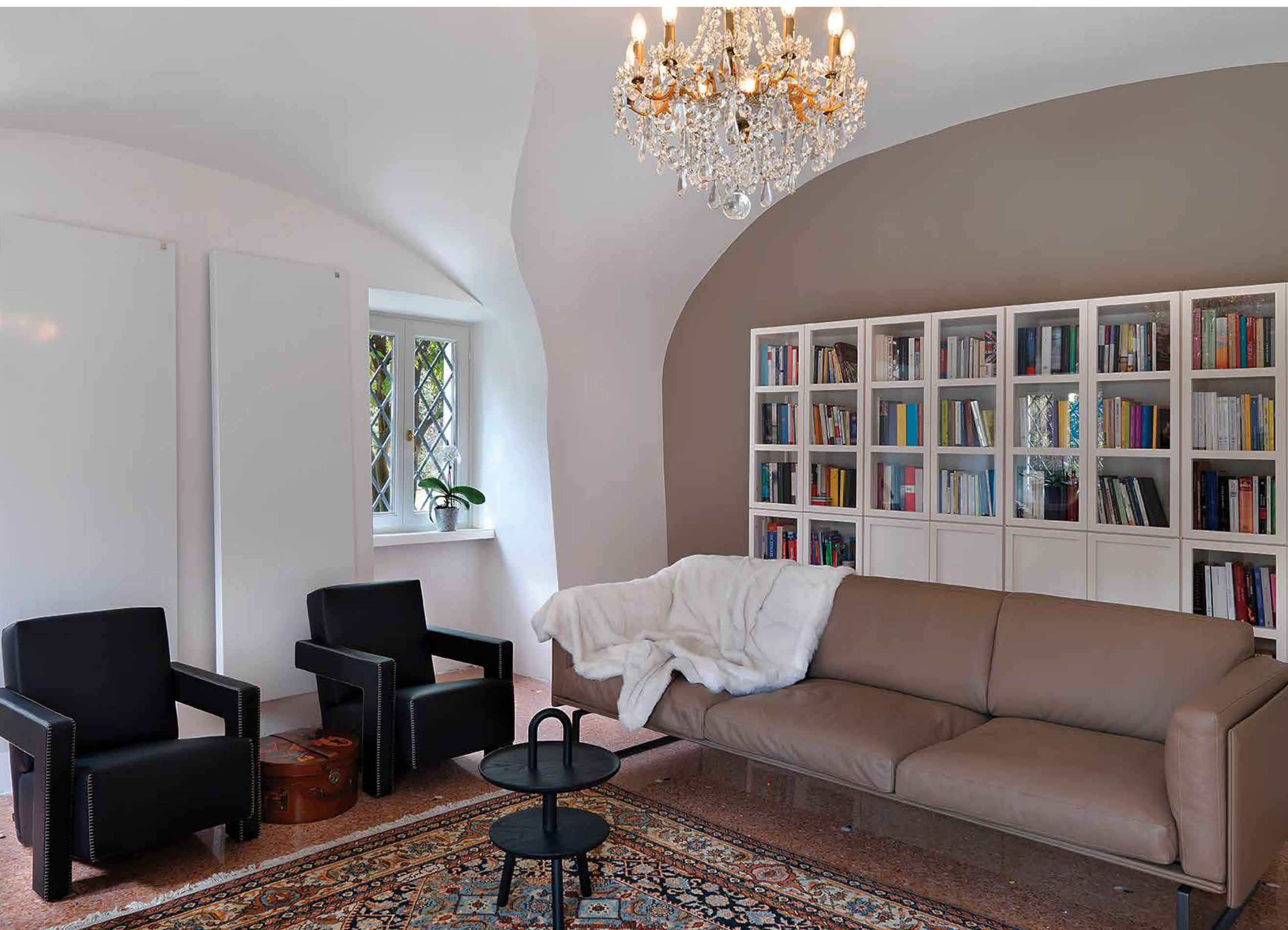
Nel living, pensato in un'ampia stanza luminosa con il soffitto a volta, la resina tortora della quinta parietale è abbinata al divano 8 di Piero Lissoni (Cassina), alle poltrone nere Utrecht (Gerrit T. Rietveld, Cassina) ed al tavolino Réaction Poétique (Jaime Hayon, Cassina); A fare da contrasto la libreria bianca Book (Titti Fabiani, Ideal Form Team). A centro stanza il raffinato lampadario originale in cristallo Baccarat di inizi '900 (Abitare Design, Proposte per un mobile qualificato, il Laboratorio delle Idee).