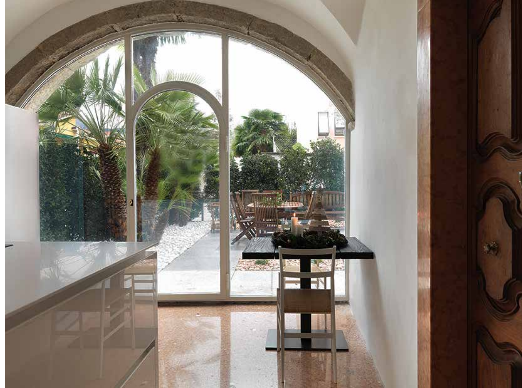
Cucina Toncelli funzionale e suggestiva, dalle linee pulite, aperta verso l'esterno e con esso comunicante tramite l'ampia vetrata ad arco; accanto un vecchio passaggio convertito in contenitore e racchiuso poi da due bellissime porte antiche in legno. Tutti i volumi sospesi sono stati integrati nel colore della resina a muro. Sullo sfondo un piccolo tavolino di Riva 1920 e la sedia Superleggera di Gio Ponti prodotta da Cassina (Abitare Design, Proposte per un mobile qualificato, il Laboratorio delle Idee).